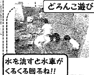
どろんこ遊び 水を流すと水車が くるくる回るね!!