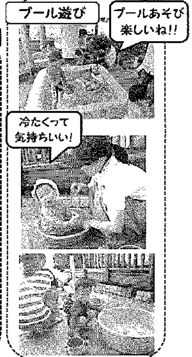
プール遊び プールあそび 楽しいね!!